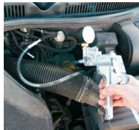
Pneumatyczny zawór EGR lub jak tutaj przetwornik elektropneumatyczny: za pomocą ręcznej pompki podciśnienia w prosty sposób można sprawdzić działanie.