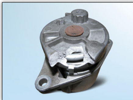
Bild 3: Beispiel eines gebrochenen Spannarmes 533 0017 10