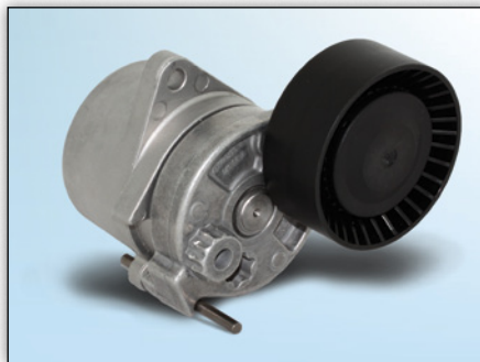
Bild 1: Vorderansicht eines intakten Spannarmes 533 0017 10