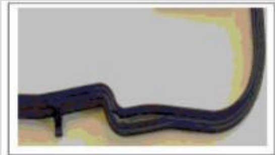
Ölwannendichtung aus Elastomer

Wir müssen leider immer wieder feststellen, dass es nach der Montage von Dichtungen aus Weichstoff und Elastomer zu Problemen und Reklamationen kommt.