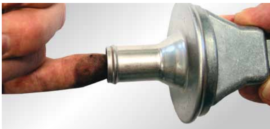
Verificarea simplă a supapei de sens unic

Ne rezervăm dreptul efectuării unor modificări și existența unor neconcordanțe în cazul figurilor.