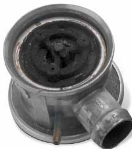
Avarii cauzate de condensul de eșapament de eșapament

Potențialele coduri defect OBD: P0410; P0411