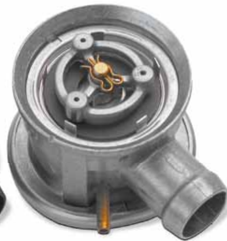
În comparație: în stare nouă

Aproape în toate cazurile aceste avarii sunt cauzate de condensul de eșapament depus în pompa de aer secundar. Pe parcursul reparației de multe ori se înlocuiește doar pompa de aer secundar.