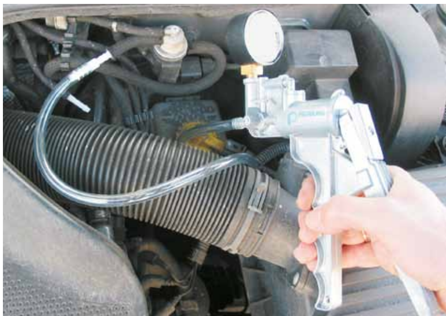
Controllo di un EPW con la pompa di depressione manuale (VW Golf IV)

Perciò un esperto con conoscenze sul sistema non dovrebbe fidarsi ciecamente di un messaggio di guasto e sostituire semplicemente un (eventuale) componente difettoso, ma memorizzare il difetto visualizzato e cercarne le cause.