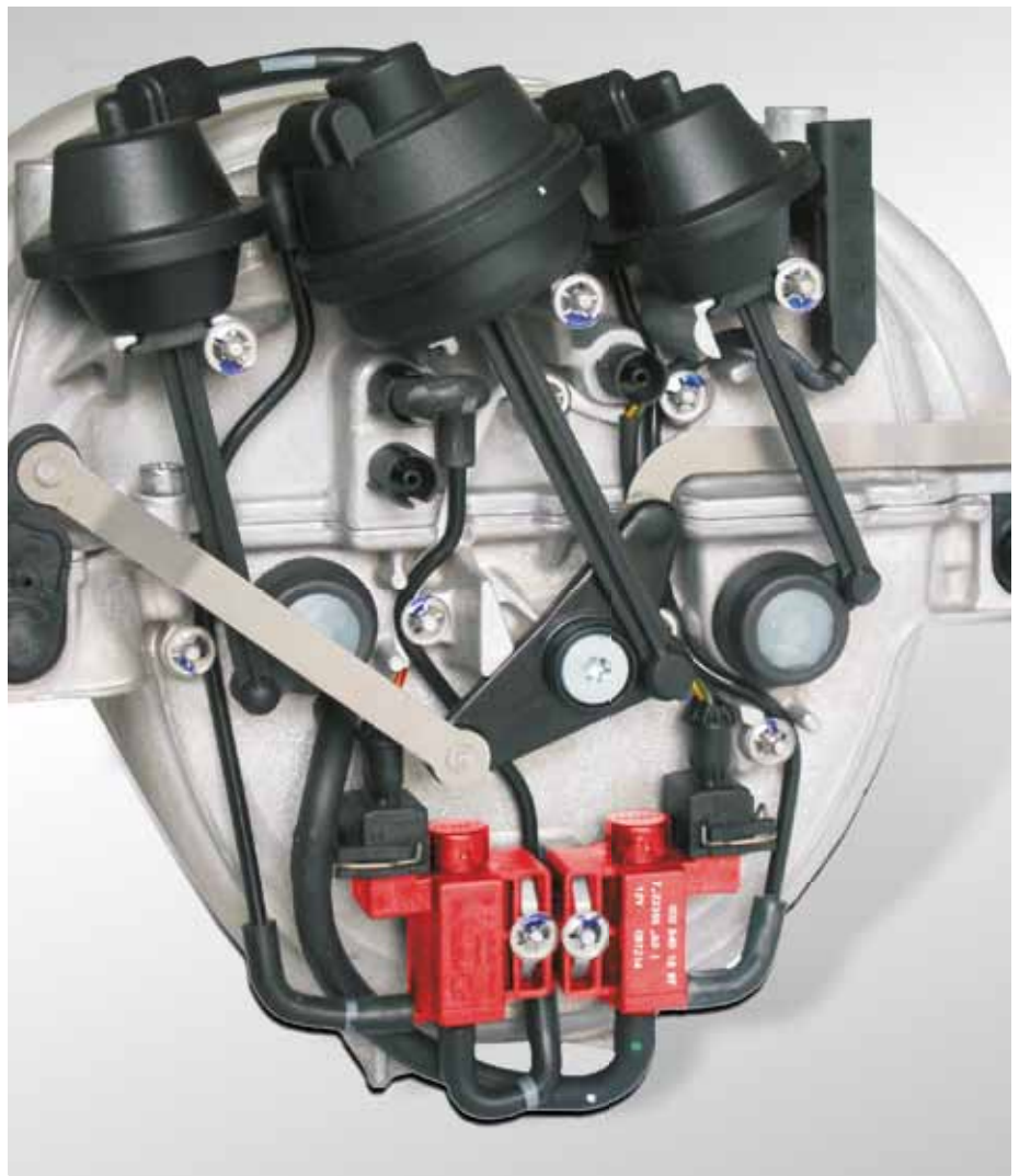
Esempi di impiego: tubo di aspirazione con valvole elettropneumatiche (evidenziate in rosso) nella Mercedes Classe C

Le valvole più usate sono elencate alle pagine successive.