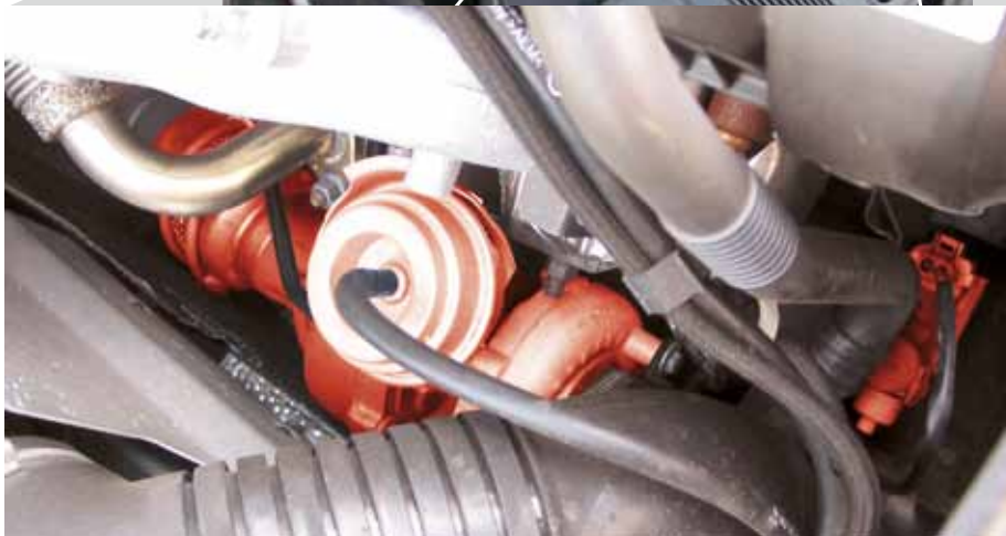
L'EPW e il compressore VTG (evidenziati in rosso) nell'Audi A4 TDI