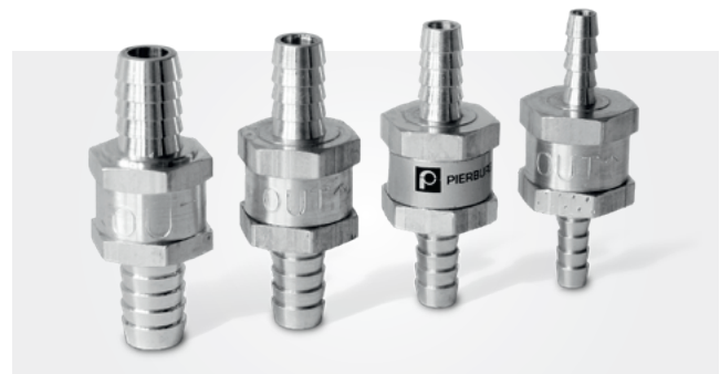
Válvulas de retenção do combustível de 6 – 12 mm

Não utilizar combinações de material que possam causar corrosão e corrosão por contato junto com alumínio: p. ex. água salgada ou superfícies galvanizadas.