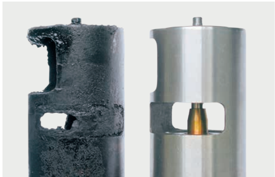
Válvula EGR pegada y nueva

Véanse las páginas siguientes para notas sobre el diagnóstico y posibles causas