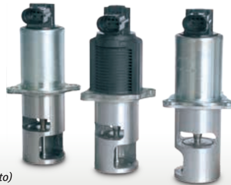
Vista del producto (extracto)

Modificaciones y cambios de dibujos reservados. Para la colocación y la sustitución, véanse los catálogos, el CD TecDoc y/o los sistemas basados en datos TecDoc.