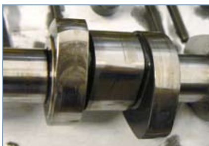
Abb.2 Eingelaufene Nockenwelle