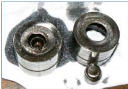
Abb.1 Beschädigte Hydrostößel (herkömmliche Ausführung)