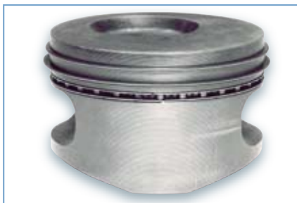
Abb. 1 Kein Verschleiß an Ringen oder am Kolben sichtbar

Die Ringe zeigen keinen sicht- oder messbaren Verschleiß. Auch die Kolben haben keine Verschleißmerkmale (Abb. 1).