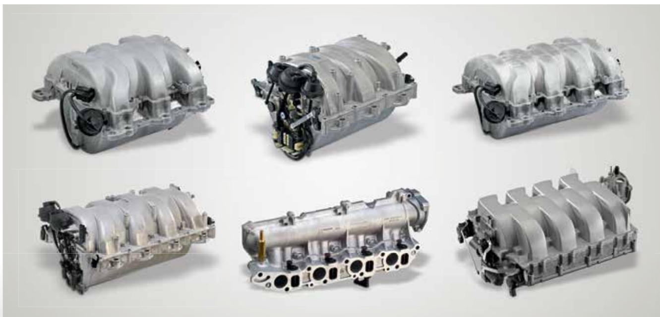
Schaltsaugrohre von PIERBURG für den Aftermarket