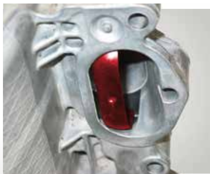
Tumbleklappe (rot hervorgehoben) für den Schichtladebetrieb