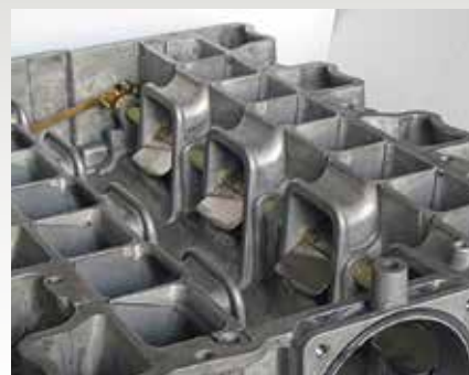
Blick in das Innere eines Schaltsaugrohrs