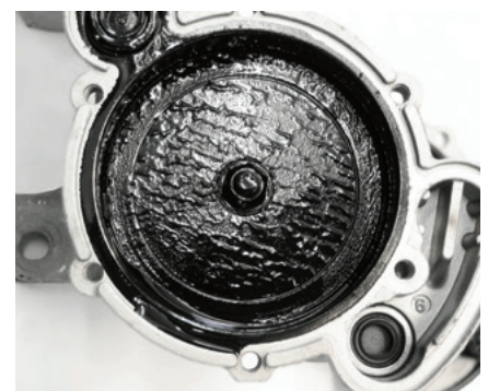
Fig. 3: El lodo de aceite en la bomba de vacío del VW Transporter produce ruidos de tableteo

Cuando una bomba de vacío errónea se monta con un taqué (3) demasiado corto resulta una reclamación similar.