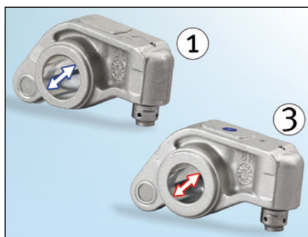
Bild 2: Der Durchmesser des Kipphebels auf der Einlassseite (1) ist größer

Beim Einbau ist auf die richtige Zuordnung zu achten. Unterschiede kann man zum einen am unterschiedlichen Durchmesser der Bohrung für die Kipphebelwelle ( Bild 2 ), zum anderen an der Kröpfung des Rollenkipphebels erkennen ( Bild 3 ).