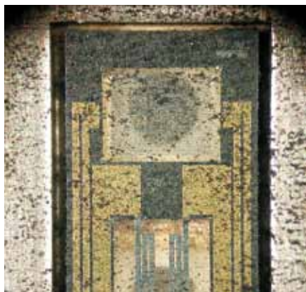
Il sale e lo sporco possono danneggiare il sensore di un sensore della massa d'aria, o per lo meno falsificare le misurazioni, cosa che può agire sull'EGR.