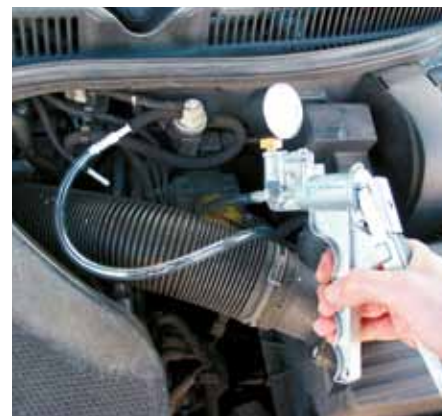
Il funzionamento delle valvole EGR pneumatiche o, come in questo caso, di un EPW: può essere facilmente controllato con una pompa di depressione manuale.