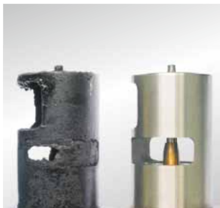
Poiché le valvole EGR non si possono coprire di fuliggine da soli, è necessario ricercare la causa della fuliggine.

Un componente guasto va sempre sostituito con uno nuovo.