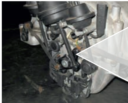
Slika oštećenja: Lom na poluzi za prebacivanje