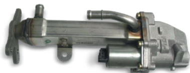
Fig. 1 : Vanne EGR avec refroidisseur EGR

Dans les refroidisseurs EGR, le liquide de refroidissement du moteur fait office d'agent refroidisseur. Les refroidisseurs se composent soit d'acier surfin, soit d'aluminium. Dans des conditions de fonctionnement défavorables ou imprévues (par ex. le fonctionnement du moteur avec un carburant à forte teneur en soufre ou du biocarburant), la production de résidus de combustion agressifs risque d'augmenter. À long terme, des fuites internes imputables à une perte lente de liquide de refroidissement sont possibles. Lors de la recherche de la fuite d'eau, les techniciens remplacent souvent les joints de culasse, les culasses ou les joints de chemise mouillés, mais souvent sans succès.