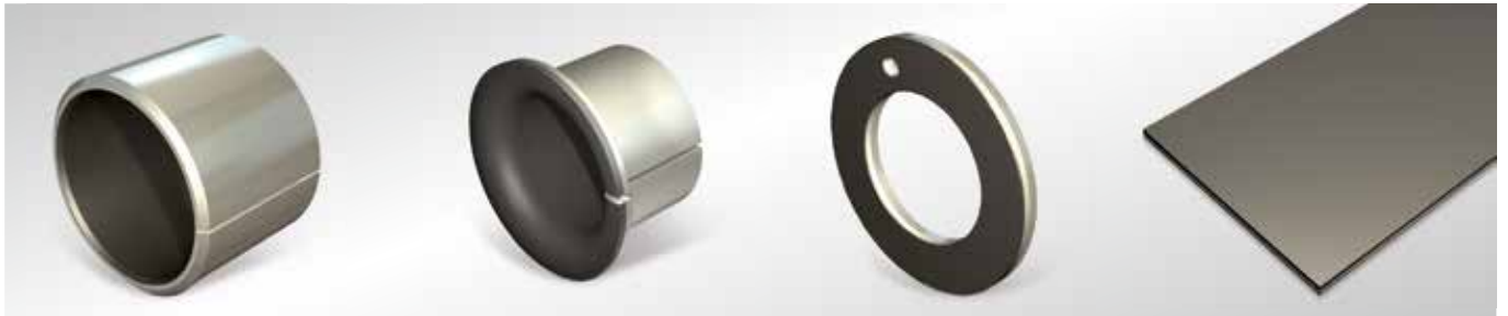
Boccole P10, P10Bz*, P14, P147*