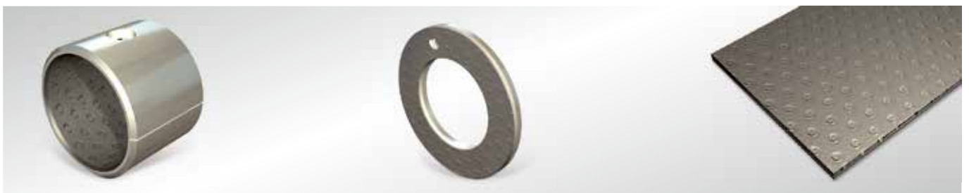
Boccole P20, P22*, P23*, P200, P202*, P203*