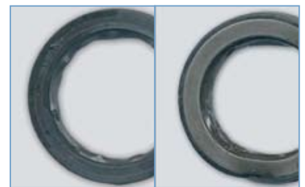
Abb.4 Beschädigte PTFE-Dichtlippe