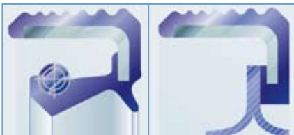
Abb.1 Standard-Radialwellendichtring (Bauart ASW)

Im Gegensatz zu herkömmlichen Radialwellendichtringen hat die PTFE-Radialwellendichtung keinen Schlauchfederring (Abb. 1+2).