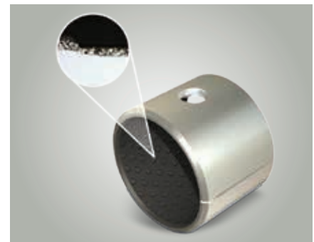
Coussinets P20 avec poches de graissage et orifice de lubrification

Les matériaux P20, P22 et P23 contiennent du plomb et ne peuvent de ce fait pas être utilisés dans le domaine alimentaire.