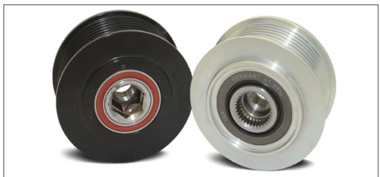
Bild 1: Generatorenfreilauf 535 0214 10

Hersteller: Honda Modelle: Accord VIII, Accord IX, Civic VIII, CR-V II, CR-V III, FR-V Motoren: 2.2 i-CTDi, 2.2 I-DTEC Art-Nr.: 535 0214 10 535 0229 10 OE-Nummern: 31141-RBD-E02 31141-RL0-G01