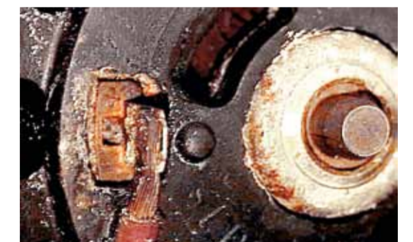
Sekundærluftpumpe – korroderede elektriske tilslutninger