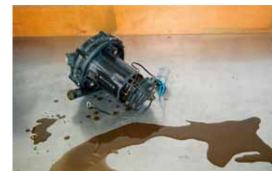
Kondensat i sekundærluftpumpen