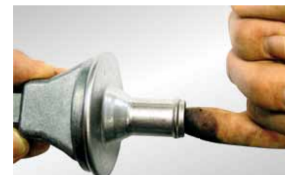
Nem kontrol af kontraventilen