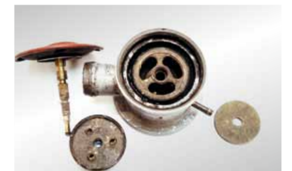
Afbrydelig kontraventil: skader (på membraner og ventilhoved) på grund af kondensat