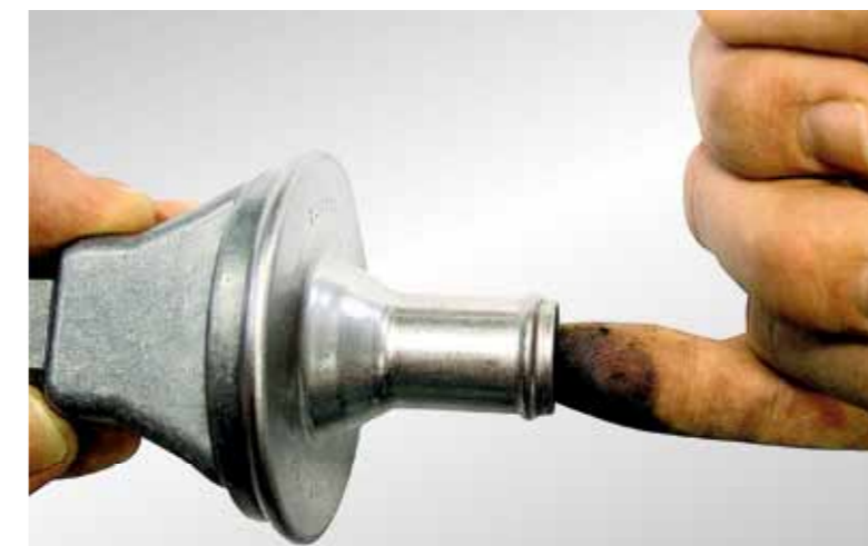
Eenvoudige controle van de terugslagklep