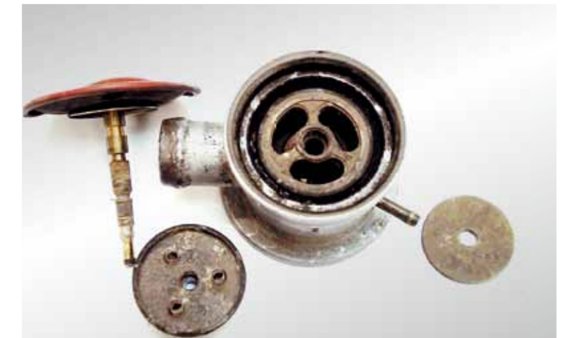
Uitschakelbare terugslagklep: schade (aan membranen en klepschotel) door condensaat