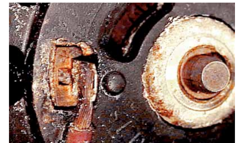
Secundaireluchtpomp – gecorrodeerde elektrische aansluitingen