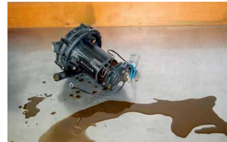
Condensaat in de secundaireluchtpomp