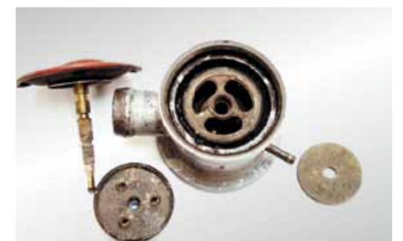
Двупозиционен възвратен клапан: Повреди (на мембраната и тарелката на клапана) поради кондензат