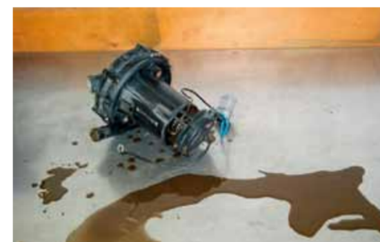
Кондензат в помпата за вторичен въздух