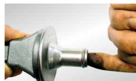
Обикновена проверка на възвратния клапан