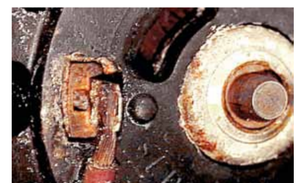
Помпа за вторичен въздух – Корозирали електрически контакти