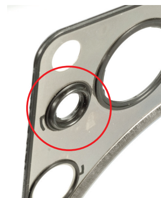
61-37770-00_3 mm höhere Gummi-Dichtlippe