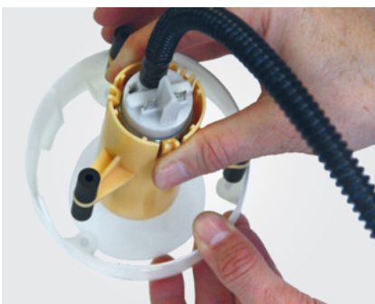
Una sustitución sencilla