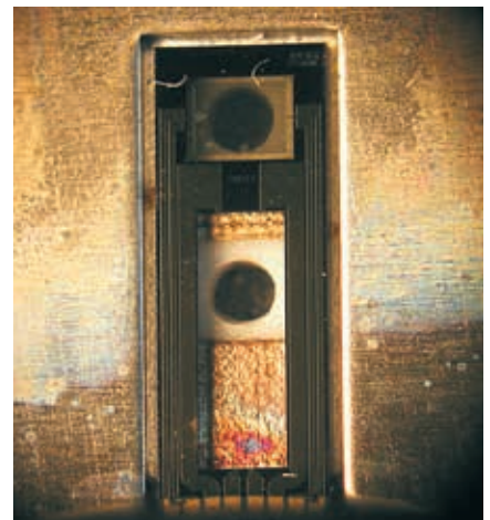
Rechts: Hier ist die Folie gar nicht mehr vorhanden. Der Sensor wirkt wie sandgestrahlt.