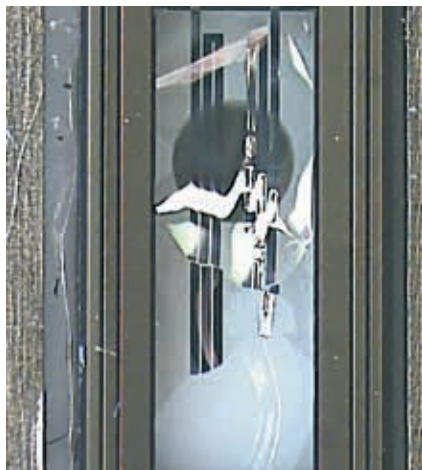
Links: Die Folie, auf der die Sensorelemente aufgetragen sind, wurde von Partikeln regelrecht „zerschossen“.