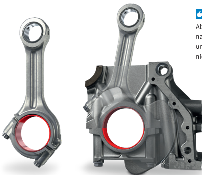
Strona łożyska korbowego i głównego obciążona naciskiem

Aby zapewnić skuteczność naprawy, remontowane silniki należy z reguły napełniać olejem pod ciśnieniem. Pozwala to uniknąć uszkodzeń różnych miejsc łożyskowania wskutek niedostatecznego smarowania podczas rozruchu silnika.