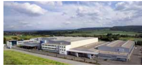
Vista aérea MS Motor Service, Neuenstadt – Alemanha.

A MS Motor Service é a organização de vendas para as atividades da Kolbenschmidt Pierburg AG no mercado de reposição em todo o mundo. Entre as marcas de primeira classe KOLBENSCHMIDT, PIERBURG, fornecemos uma linha completa de produtos do motor e para motores, atendendo à sua demanda.