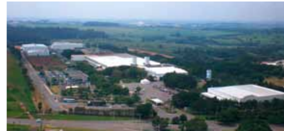
Vista aérea KSPG Automotive Brazil Ltda. Nova Odessa - SP - Brasil.

A divisão MS Motor Service é a organização de vendas para as atividades da KSPG Automotive Brazil Ltda. no mercado de reposição em toda a América Latina. Entre as marcas de primeira classe KOLBENSCHMIDT, PIERBURG, fornecemos uma linha completa de produtos para motores, atendendo à sua demanda.