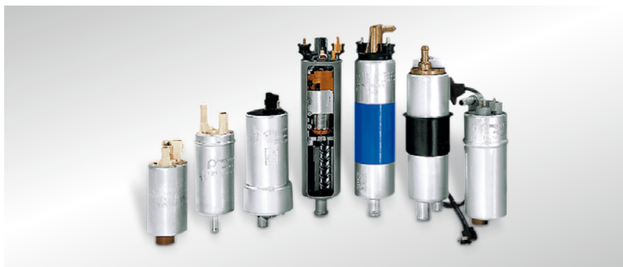
Fig. 14 Schéma du système d'alimentation en carburant

Les composants utilisés à cet effet sont rassemblés sous la dénomination « système d'alimentation en carburant ».