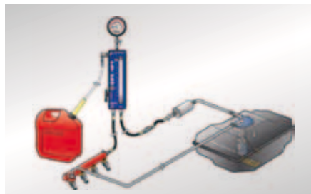
Beispiel: Messanordnung im Kraftstoffsystem mit Rücklauf

Bitte beachten Sie die Sicherheitsbestimmungen mit hochbrennbarem Kraftstoff beim Einsatz der Werkzeuge!