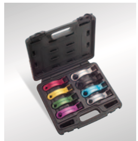
Werkzeugsatz für Kraftstoffdruck-Prüfkoffer

Werkzeugsatz für Kraftstoffdruck-Prüfkoffer (4.07373.21.0) zum Öffnen von Schnellkupplungen (Quick Connectors)