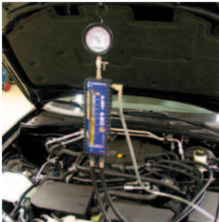
Anwendung im Fahrzeug

Das Testgerät wird normalerweise direkt in den Kraftstofffluss angeschlossen. Eine Einbaustelle entlang der Kraftstoffversorgungsleitung nahe an der Kraftstoffverteilerleiste ermöglicht z.B. die präzise Messung des Kraftstoffdrucks und der