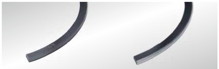
Anel versão com molibdênio