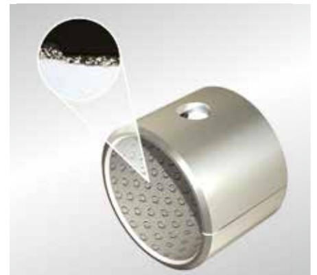
P200 – Gleitlager mit Schmiertasche und Schmierloch

P202 und P203 haben glatte Gleitflächen und sind unter hydrodynamischen Bedingungen einsetzbar. P202 ist nacharbeitbar.