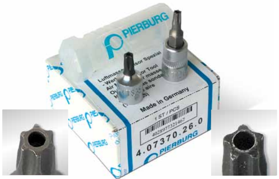
Suplemento T 20 (6 dientes, Torx®) con orificio frontal

El cambio de los sensores de masas de aire montados de serie se dificulta cuando se utilizan tornillos especiales. Para la reparación en estos casos, Motor Service ofrece un nuevo juego de herramientas especial formado por 2 piezas. Estos tornillos especiales tienen la particularidad de que el tornillo, con un perfil de 5 o de 6 dientes, tiene en el centro una espiga. A través de los orificios frontales en las piezas pueden abrirse estos tornillos especiales. Las dos herramientas son suplementos de ¼ de pulgada en calidad MSI demostrada, aptos para carracas o llaves de vaso corrientes de ¼ pulgadas.