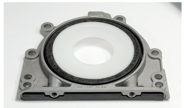
Abbildung 2_Unterseite integrierter Wellendichtring

VICTOR REINZ – der beste Weg eine gute Dichtung zu bekommen.