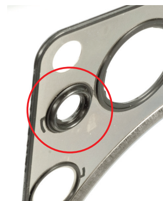
61-37770-00_Lèvre d'étanchéité surélevée de 3 mm