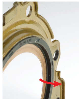
Figure 1 _La lèvres d'étanchéité est orientée vers la boîte de vitesses

Tenir impérativement compte de la notice de montage des bagues d'étanchéité en PTFE contenue dans le jeu.