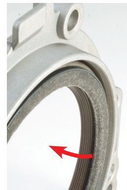
Figure 2 _La lèvres d'étanchéité est orientée vers l'intérieur du moteur