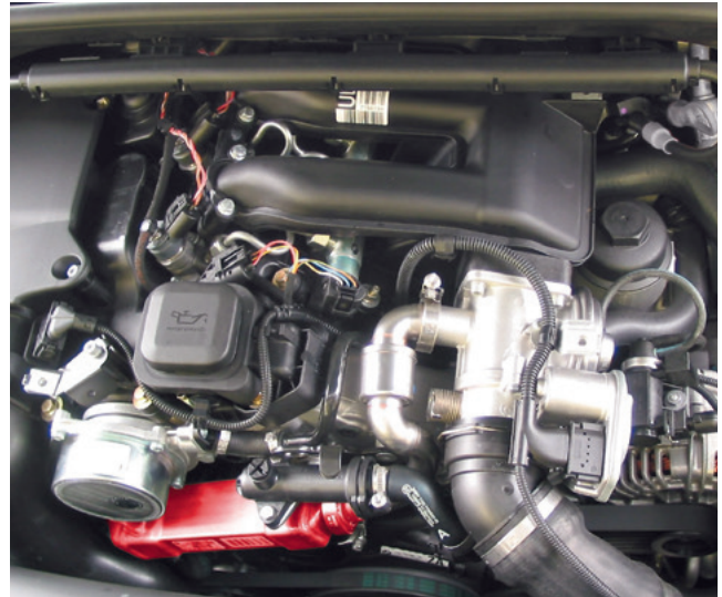
AGR-Kühler in einem BMW 318d (rot hervorgehoben)

Der Begriff „Stickoxide“ ist eine Sammelbezeichnung für die gasförmigen Oxide des Stickstoffs. Sie werden mit NOx abgekürzt, da es auf Grund der vielen Oxidationsstufen des Stickstoffs mehrere Stickstoff-Sauerstoff-Verbindungen gibt. Stickoxide reizen und schädigen die Atmungsorgane, sie sind mitverantwortlich für die Smog- und Ozonbildung und unterstützen die Bildung des sauren Regens.