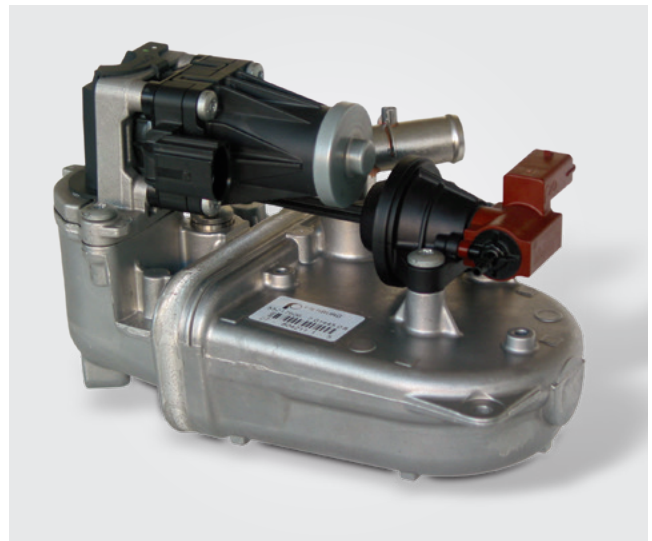
Pierburg AGR-Kühlermodul mit integriertem AGR-Ventil und Bypassklappe, verbaut bei Fiat und GM