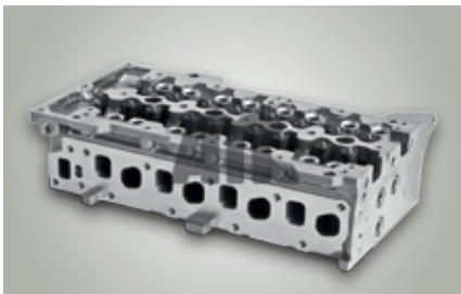
Culasse 169A1-A5.000 / 199A2-A3-A9.000 / 199B1-B4.000 / 263A2.000 Fiat – réf. origine : 71749340 / 71724174