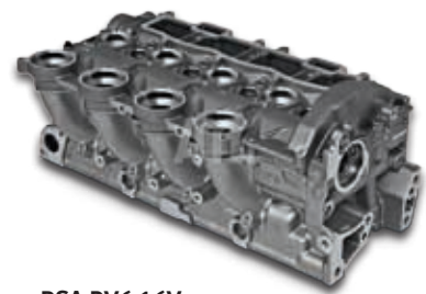
PSA DV6 16V