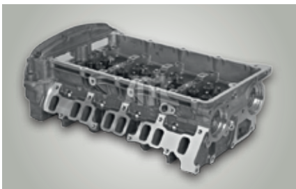
Culasse 4HU / P8FA / QVFA / QWFA Peugeot – réf. origine : 0200GW