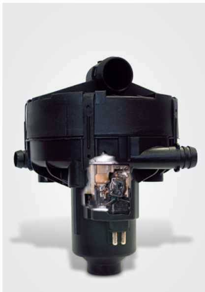
Vista della pompa aria secondaria (sezione) con tracce di materiale fuso