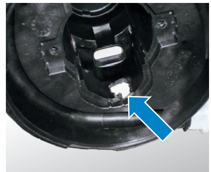
Tipologia di danno: tracce di materiale fuso nella scatola (vista dall'alto della scatola)