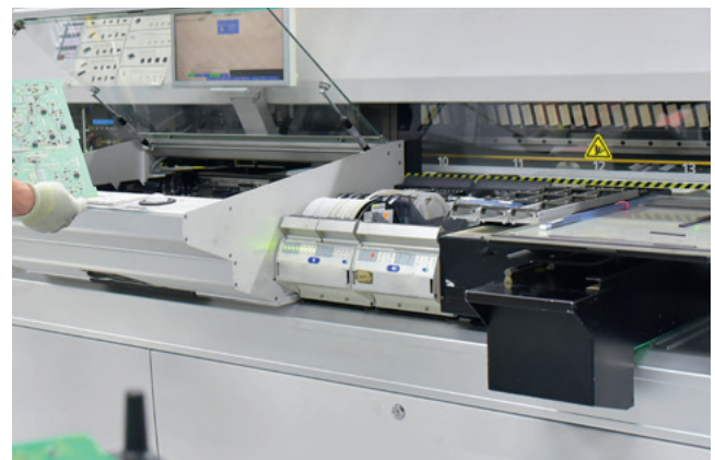
Máquina automática para montar elementos

En esta aplicación, el alojamiento en la guía de carro se ha efectuado con 2 tiras de deslizamiento sin mantenimiento y del material KS PERMAGLIDE® P10. El carro se desliza fácilmente y sin sacudidas sobre la tira y, de esta forma, puede posicionarse con mucha precisión.