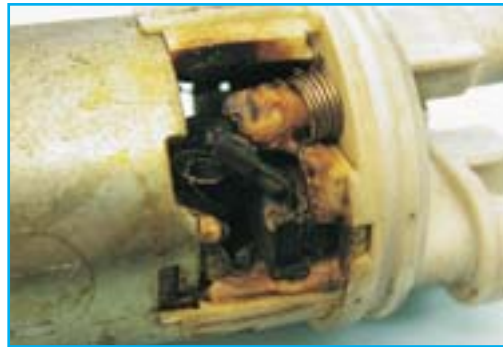
Uszkodzenie w wyniku pracy na sucho

Po stronie tłocznej pompy paliwa musi zawsze być zainstalowany filtr paliwa.