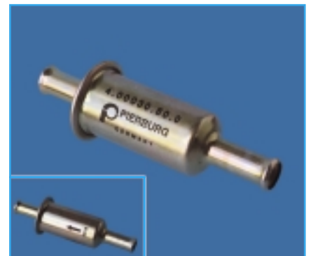
Vista del producto 4.00030.80.0

El filtro previo debería cambiarse al mismo intervalo de mantenimiento que el filtro de combustible.