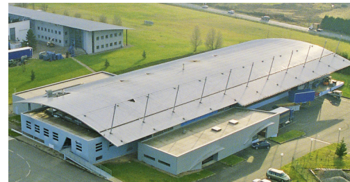
ElringKlinger Meillor SAS, Standort Chamborêt. Fertigungsprogramm: Zylinderkopfdichtungen und Spezialdichtungen.

Insbesondere in Frankreich mit ElringKlinger Meillor SAS und in Italien mit ElringKlinger Oigra-Meillor s.r.l. konnte die Marktstellung sowohl im Erstausrüstungs- als auch im Ersatzteilbereich deutlich gestärkt werden. ElringKlinger Oigra-Meillor in Settimo-Torinese ist seit Juli 2011 für den Vertrieb von Elring-Produkten in Italien zuständig.