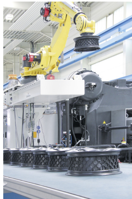
Konzeptstudie einer Pkw-Felge aus Kunststoff, gefertigt bei Hummel-Formen GmbH