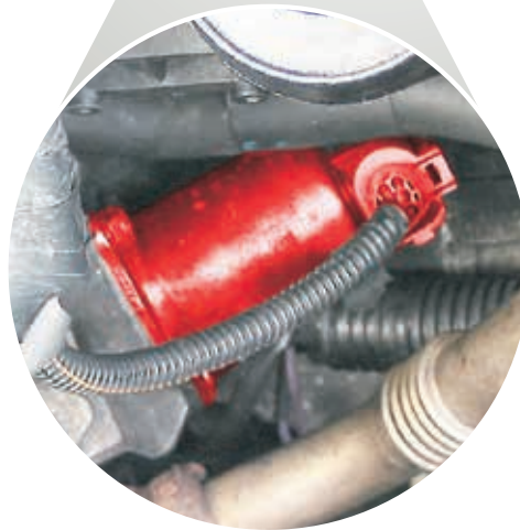
EGR szelep a Renault Master JD1M típusban (kiemelve)

1 Gázátfúvás: Az a kiszivárgott gázmennyiség, amely normál égés során a dugattyúgyűrűk mentén a forgattyúházba kerül. A forgattyúház szellőztetése nyomán ezeket a gázokat visszavezetik a motor égésterébe.