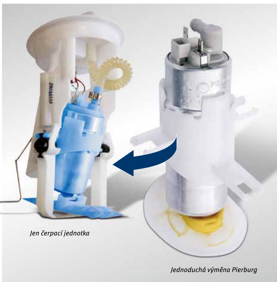
Jen čerpací jednotka