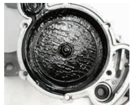
3. ábra: A vákuumszivattyúban lerakódott olajszap a VW Transporter-ben csattogó hangokat kelt

Hasonló a panasz akkor is, amikor egy rossz vákuumszivattyúba túl rövid lökőrúdat (3) szerelnek.