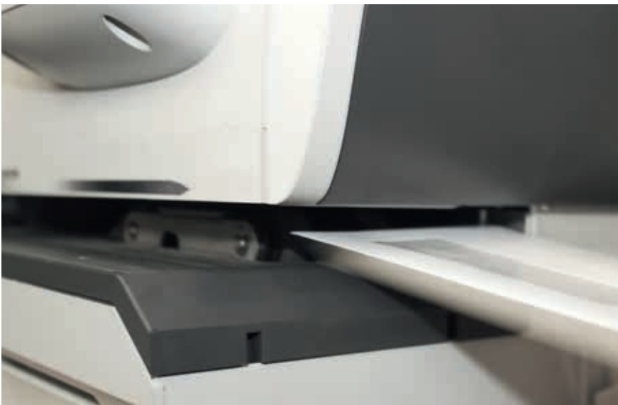
Application sur une machine à affranchir