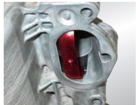
Farfalla tumble (evidenziata in rosso) per il funzionamento a carica stratificata