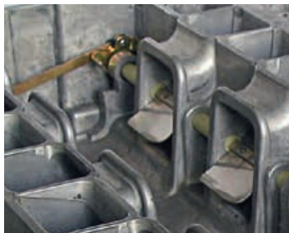
Uno sguardo all'interno di un collettore di aspirazione a geometria variabile