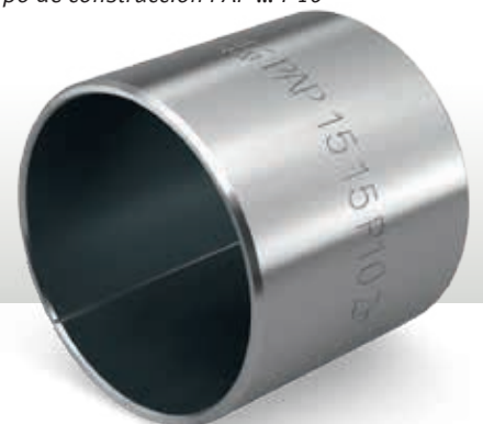
Casquillo de cojinete KS PERMAGLIDE® Tipo de construcción PAP ... P10