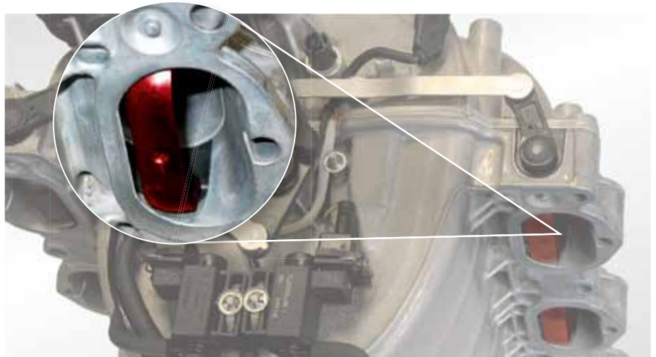
Clapets tumble (mis en évidence en rouge) dans la tubulure d'admission PIERBURG, par ex. dans la Mercedes classe E 500