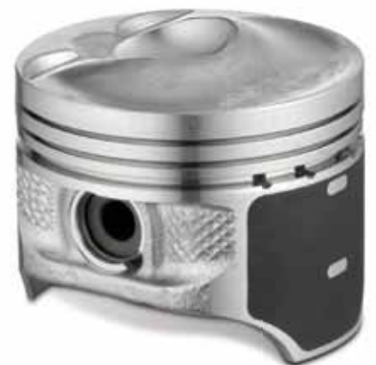
Pistons KS avec fond de piston spécial pour le mode charge stratifiée

Un papillon pas complètement ouvert dans le système d'aspiration réduit l'admission d'air frais. La résistance ainsi obtenue génère des « pertes d'étranglement ». Toute mesure permettant d'ouvrir davantage le papillon (« Augmentation de l'ouverture du papillon »), réduit ces pertes d'étranglement et la consommation.