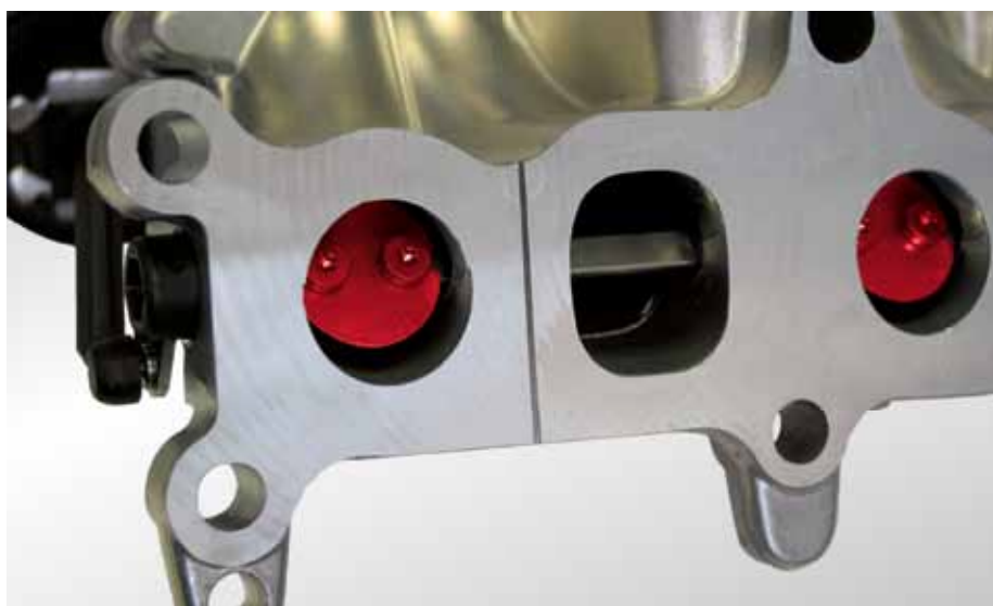
Deux canaux par cylindre : clapets à torsion (mis en évidence en rouge) dans la tubulure d'aspiration PIERBURG, par ex. dans l'Opel Astra J 1.7 CDTi

Sous réserve de modifications et de variations dans les illustrations. Pour les références et les pièces de rechange, cf. le catalogue actuel, le CD TecDoc ou encore les systèmes se basant sur les données TecDoc.